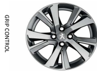
17" Diamanté Eridan Anthra grey