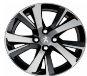
17" Eridan Noir Brillant