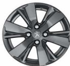
16" HYDRE DILLIUM Grey